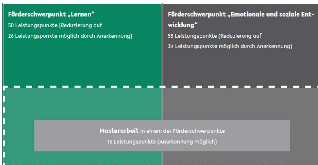
Abbildung 1: Überblick über den Studienaufbau

(4 Semester, Verkürzung auf 2 Semester möglich durch Anerkennung)