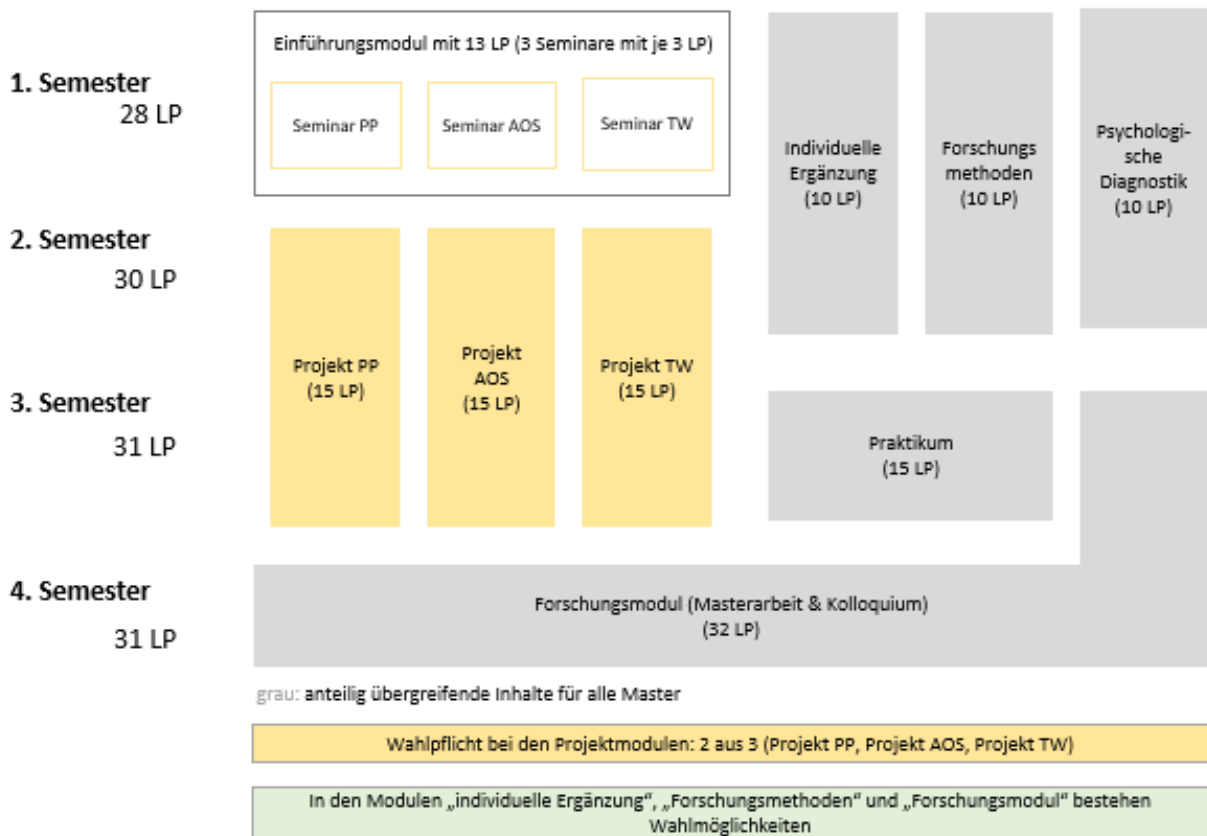
Abbildung 1: Studienverlauf

Informationen zum Studienverlauf finden sich in der Studieninformation . Dort ist die Modulstrukturtable auch in den Fächerspezifischen Bestimmungen veröffentlicht. Es folgt eine grafische Darstellung des Studienverlaufs: